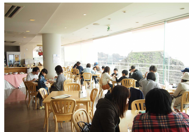
レストラン「フルーツ」