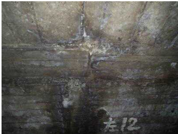
トンネル上部のコンクリートの劣化 (秋田内陸線)