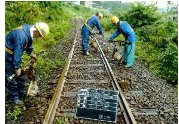
レール交換作業 (鳥海山ろく線)