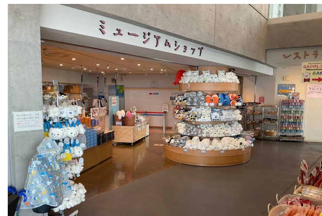
売店「ミュージアムショップ」